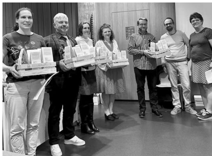
Le Conseil synodal félicite chaleureusement les 5 ministres et leur souhaite tout le meilleur et la bénédiction de Dieu